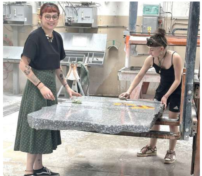
L'Ifrès c'est aussi les filles...

L'IFRES continue de s'engager dans divers projets enrichissants pour ses apprentis.