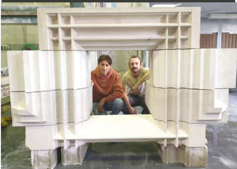
Partenariat avec le château de Montfa

Ces collaborations témoignent de l'engagement du CFA IFRES à offrir à ses apprentis un environnement riche et varié, tout en soutenant l'économie locale et/ou de filière et en tissant des liens solides avec les acteurs du secteur, tant géographique qu'économique.