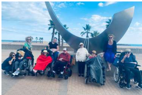
Les joyeux lurons à la mer