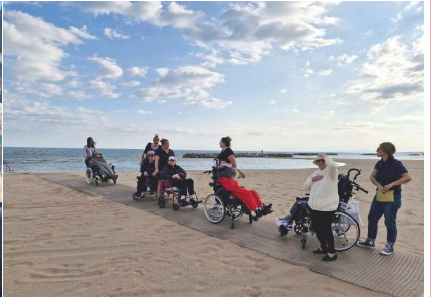
Visite des écluses (au nombre de 9) de Fonsérannes près de Béziers

Le mercredi, certaines familles ont rejoint le petit groupe pour partager un repas tous ensemble.