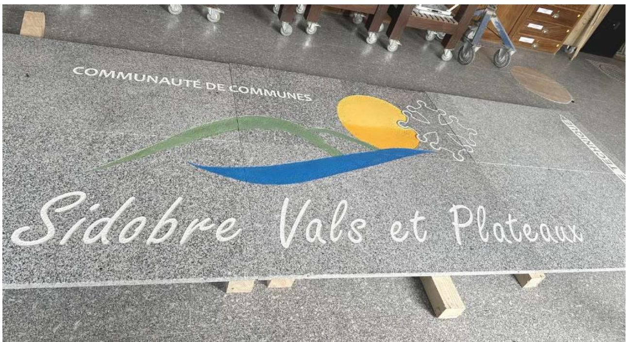
Réalisation pour la Communauté de Communes Sidobre Vals et Plateaux

11 en BMA Gravure sur pierre : 8 BMA1 et 3 BMA2