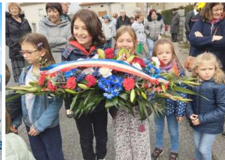
Les enfants le 11 novembre