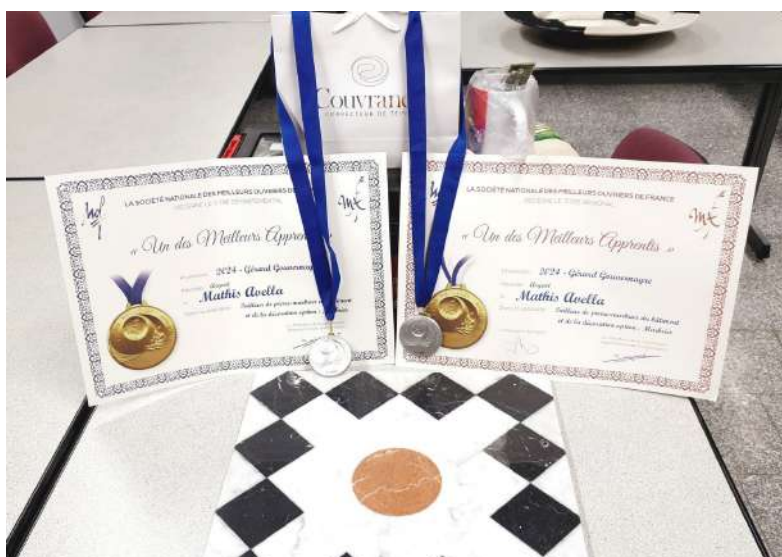
Quelques unes des médailles récoltées et le sujet imposé au concours du Meilleur Apprenti de France 2024

Financièrement, le CFA IFRES fait face à des défis importants pour l'année à venir, en raison de la réduction des subventions régionales et de la diminution des aides à l'apprentissage au niveau de l'État.