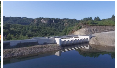
Barrage de Rassisse