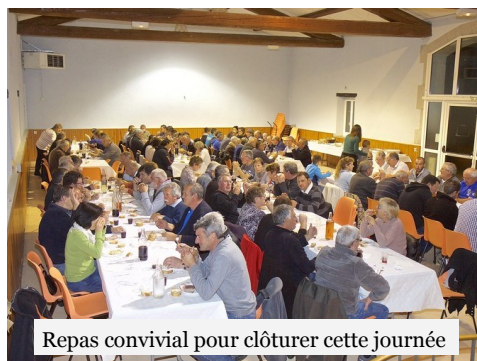
Repas convivial pour clôturer cette journée