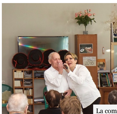
La commission sociale à la Maison de retraite