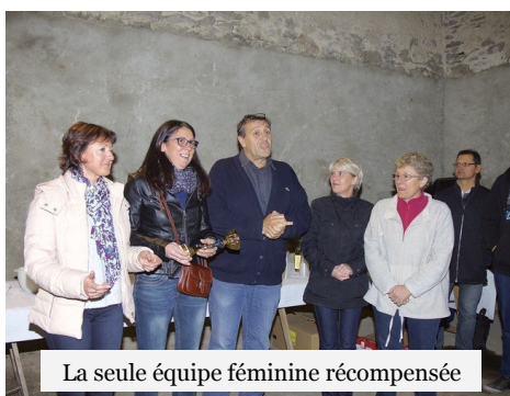
La seule équipe féminine récompensée