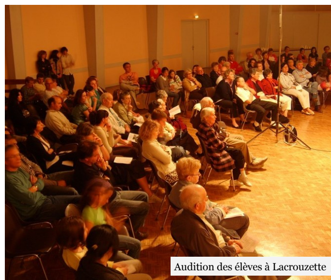
Audition des élèves à Lacrouzette