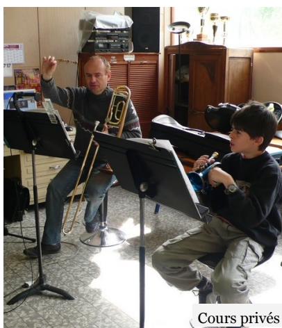
Cours privés et collectifs