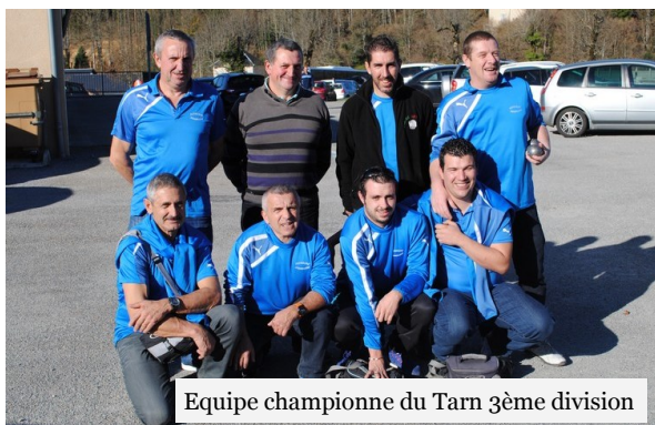
Equipe championne du Tarn 3 e me division

de ce fait en 2 e me division. A noter qu'un concours officiel devrait être organisé en 2016, la date restant à définir.