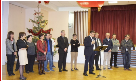
Bonne Année à tous...les vœux de M. le maire