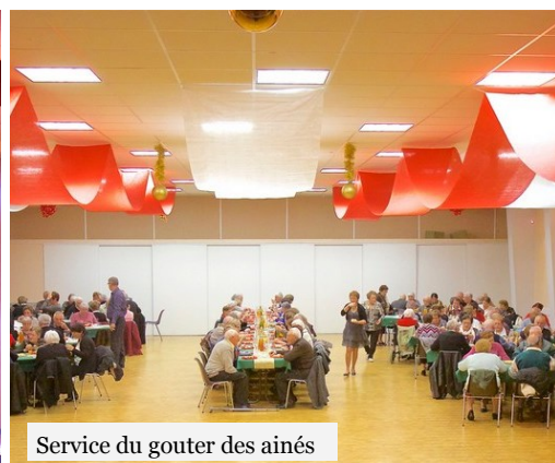
Service du goûter des aînés