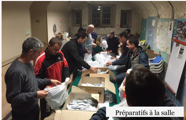
Préparatifs à la salle

En effet, ce ne sont pas moins de 730 vététistes qui se sont inscrits cette année à notre randonnée qui est devenue un évènement majeur de notre commune et nous en sommes fiers.