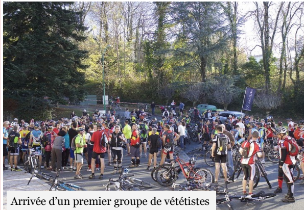
Arrivée d'un premier groupe de vététistes