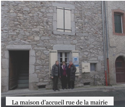
La maison d'accueil rue de la mairie

En collaboration avec l'assistance sociale du secteur, l'équipe soutient les familles les plus défavorisées : aide financière, aide alimentaire, aide à la santé, à l'énergie et à l'eau .