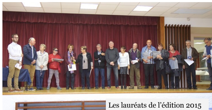
Les lauréats de l'édition 2015