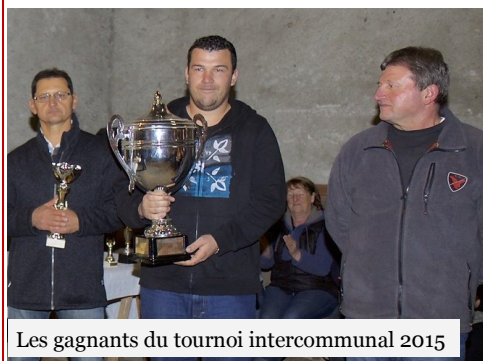
Les gagnants du tournoi intercommunal 2015

La pétanque Sidobrienne vous souhaite une bonne année 2016.