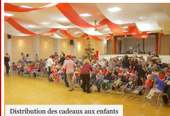
Distribution des cadeaux aux enfants

Un petit café et des boissons étaient prévus pour les enfants et les accompagnateurs, puis chacun a repris le chemin de l'école.