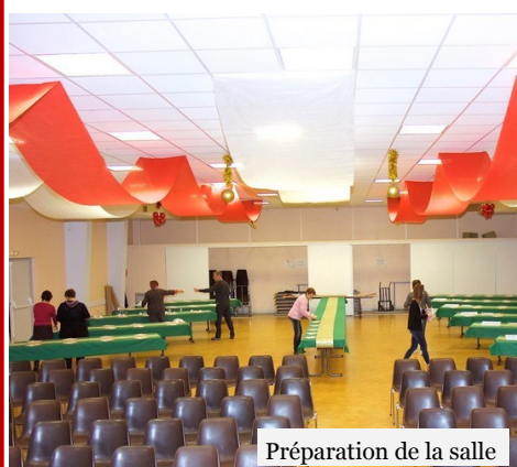
Préparation de la salle

Les 120 personnes qui ont participé au goûter ce 13 décembre ont pu apprécier un spectacle de qualité produit par la troupe « Dancencore » avec leur présentation « souvenir d'antan » ponctué de chansons et de danses très variées dans un décor de jeux de lumière. Après ce moment de détente, un goûter leur a été servi par les membres de la commission. L'après midi s'est terminée par quelques pas de danse.