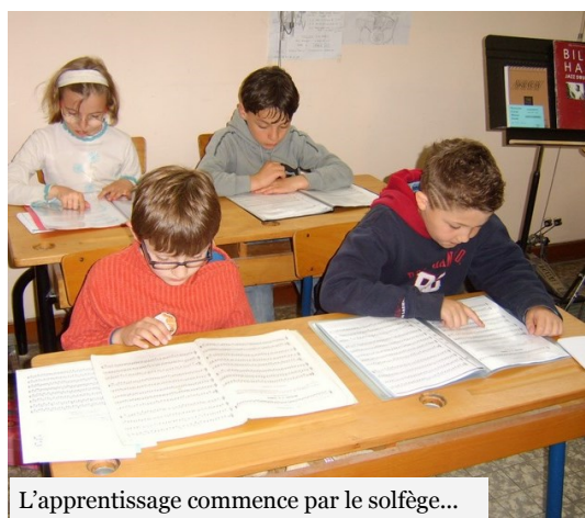
L'apprentissage commence par le solfège...