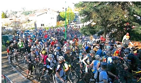
Départ de la ronde des rochers