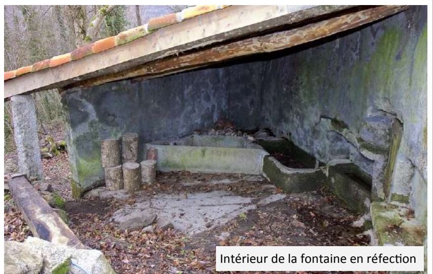
Intérieur de la fontaine en réfection

Photo de l'ancienne école construite en 1871 qui accueillera à partir de 1878 les enfants de Cros et Crémaussel, et qui sera fermée dans les années 1960.