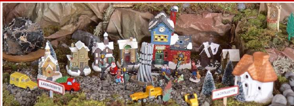
La crèche de la maison de retraite