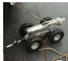
Robot caméra qui a inspecté le sous sol

Nous espérons que ces travaux n'affecteront pas trop les finances locales.