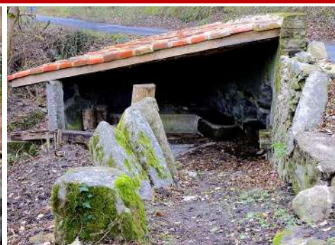
Le lavoire de Cros