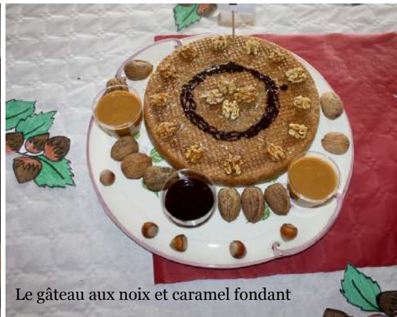
Le gâteau aux noix et caramel fondant