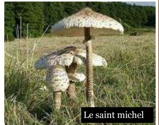
Le saint michel

Le saint michel (ou coulemelle) : environ 40cm de haut, chapeau parsemé de plaques écailleuses, les lamelles sont blanches, son pied creux rigide