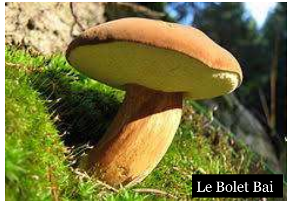
Le Bolet Bai

le Cèpe : chapeau brun ou noisette, pied cylindrique plutôt blanc