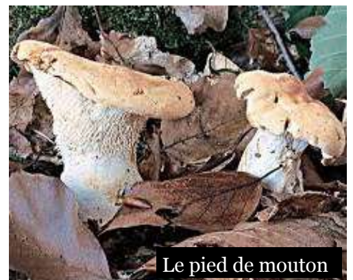
Le pied de mouton

le Pied de Mouton : chapeau 10cm de diamètre, son aspect est épais, ondulé, bosselé, blanc crème et velouté. Le pied est excentré et court, charnu de même couleur que le chapeau.