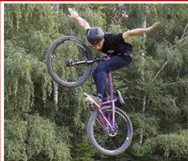
Festiride : le saut de l'ange ?