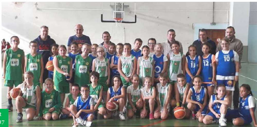
Equipe U11 de Castres, Brassac, Roquecourbe et Lacrouzette, tournoi open brassage, octobre 2017