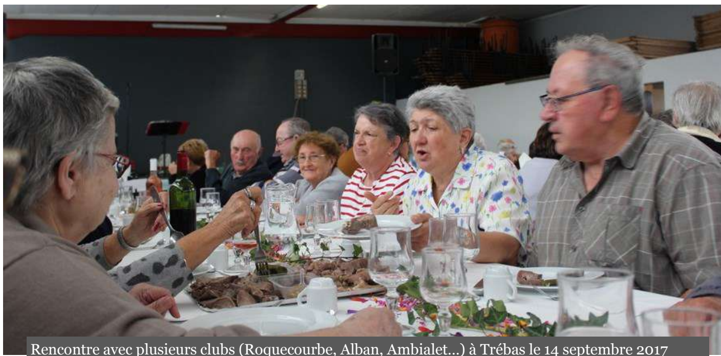
Rencontre avec plusieurs clubs (Roquecourbe, Alban, Ambialet...) à Trébas le 14 septembre 2017

Que peut-on demander de plus : LA SANTE... OUI ! QUE CA CONTINUE ... AUSSI !