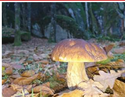
Ils sont bien sortis...