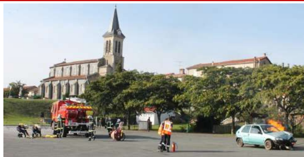
Merci aux pompiers d'être là...